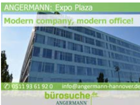
ANGERMANN: Expo Plaza